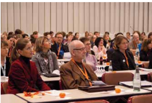
Abb. 2. Rund 320 Personen aus der Krankenhausapotheke, der öffentlichen Apotheke, aus Universitätsinstituten und der pharmazeutischen Industrie bekamen in Plenar- sowie zahlreichen Kurzvorträgen, aber auch in Workshops und in der Posterausstellung ein informatives Programm zum Thema Arzneimittelinformation geboten.

Um eine sichere und effektive Anwendung von Medikamenten zu gewährleisten, bedarf es der praxisorientierten Arzneimittelinformation, erklärte sie. Sie beschrieb die Lehre des Faches Klinische Pharmazie an der Universität Heidelberg, die von der Kooperationseinheit Klinische Pharmazie – das sind die Abteilung Klinische Pharmazie und Pharma-