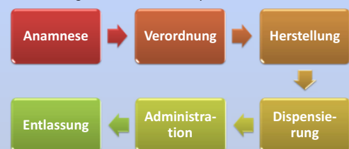
Abbildung 2: Der Medikationsprozess